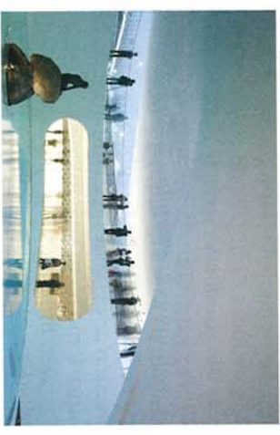
Oben: eine weiße Doppelhelix für Dänemark von Bjørnstjerne Ingels Group. Unten: Auf der bewegten Landschaft aus grauem Kunstgras vor dem britischen Pavillon ruhen sich die Besucher gerne aus.