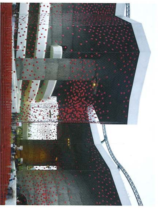
Oben: der Schweizer Pavillon von den Basler Architekten Buchner Bründler, unten: der spanische Pavillon, entworfen von Benedetta Tagliabue (siehe auch Titelbild dieser Ausgabe)

Den hinreißenden spanischen Auftritt hat Benedetta Tagliabue entworfen. Die Struktur des amorphen Baukörpers besteht aus Stahlrohrfachwerk. Ein Schuppenkleid aus matratzengroßen Weidengeflecht pads schützt den Bau gegen die Sonne. Innen wird in bild- und tonmächtigen Shows Flamenco, Siterkampf und alles Weitere gezeigt, was man so für spanisch halten soll.